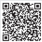
Solo-Man 談財富與人生 收聽頁面