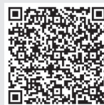
香港的良友電台播客