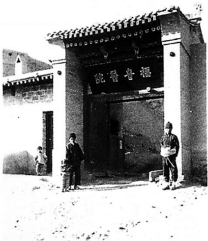
● 圖片取材自蘭州市第二人民醫院網頁 http://www.lzseyy.com/zjp_level.asp?page=3&ClassID=89

博德恩留下了100萬美金的遺產，並且全數奉獻出來，其中25萬美金捐給以向中國傳福音為宗旨的中國內地會，內地會用這筆捐款在中國的甘肅省蘭州成立了一所以服務穆斯林為主的醫院，名為「博德恩福音醫院」，後來成為「蘭州市第二人民醫院」，威廉·博德恩的死也激勵了許多基督徒前往中國宣教，為他毫無遺憾的人生畫下完美的句點。