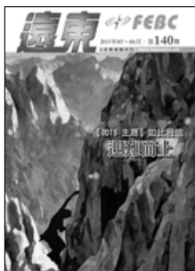
封面影像設計 | Zoe |