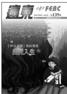
封面影像設計 | Zoe |